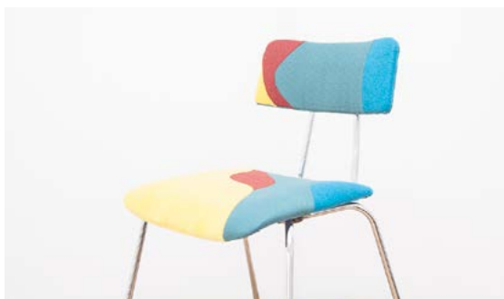
Chaise «La Plage» - Pièce unique.