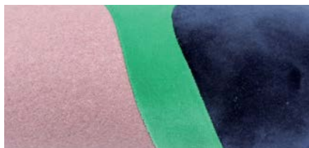
Détail, tabouret «Cocagne».