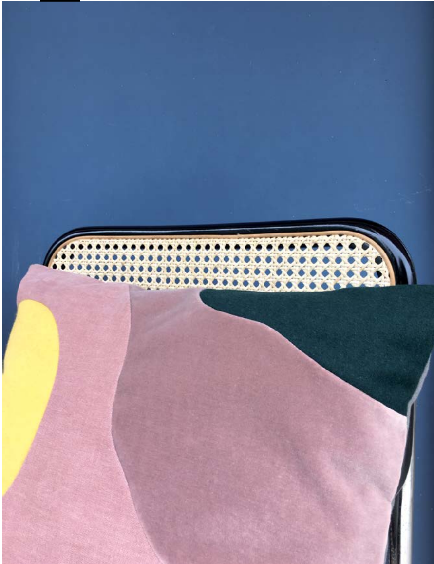
Coussin, Collection «Full Moon», série limitée.