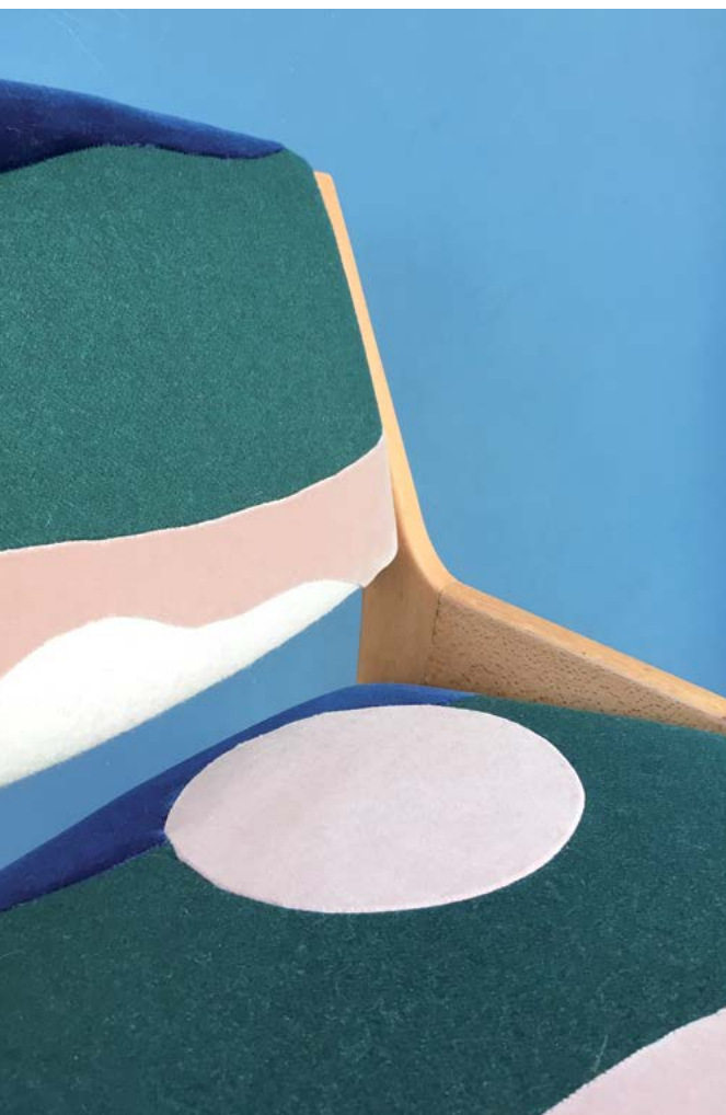
Coussin rond, Collection «Full Moon» - série limitée.

Depuis quelques années nombreux sont les créateurs qui éditent des collections élaborées avec la même exigence que les pièces réalisées sur mesure pour les besoins de chantiers privés. Grâce à la maîtrise totale de sa production, réalisée dans son atelier à Bayonne, Sonia Laudet signe une gamme d'assise imaginée au gré de ses inspirations. Si certaines pièces demeurent uniques, d'autres seront produites en série. Sonia Laudet développe aussi régulièrement des collaborations avec des concepts-store pour des séries limitées.